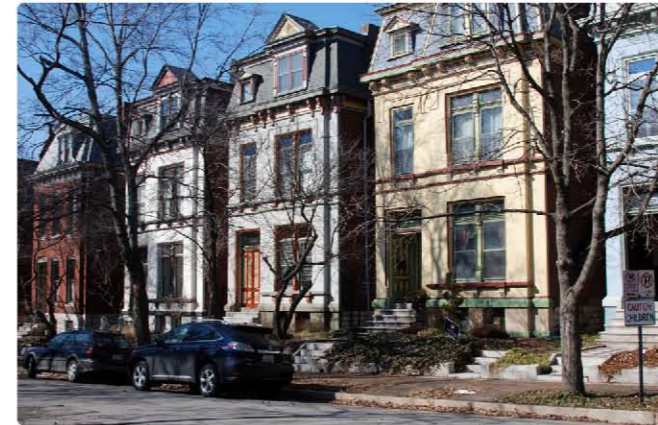
<사진 1> 경제적 바탕이 약해진 도시와 건축이 어떻게 몰락하는지를 보여주는 세인트루이스 다운타운과 과거의 중상층 주거지

도시는 확장하고 성장할수록 주택난이 발생한다. 한정된 공간에 다양한 기능의 건축이 세워져야 하기 때문이다. 동시에 일자리를 찾아오는 사람들이 늘어나면서 주택문제는 심각한 정치 사회적 해법을 요구하게 된다. 그런 대안으로 근교 도시(Suburban) 또는 신도시가 개발되고, 물리적 거리와 새롭게 구성된 지역으로 사람들을 유도하기 위해 다양한 정책으로 환경을 개선한다. 2) 새롭게 개발된 지역에 투입된 자원과 정책은 가시화가 선명하고 효과가 두드러지기 때문에 우선될 수밖에 없다. 이런 정책 자체가 기존 도시에 대한 불공정함을 수 있다. 신도시 지역이 매력적 경쟁우위에 있게 되면서 당연히 기존 도심 거주자들이 이동하게 된다. 그렇게 기존 도심 거주자들이 이동하고 나면, 기존 지역은 쇠퇴하게