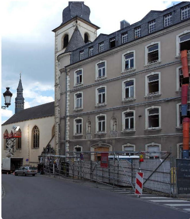
<사진 2> 룩셈부르크의 다운타운 건축은 강력한 건축 가이드라인과 지침에 따라 건축적 형식은 유지한 상황에서 내부 리모델링을 통한 새로운 프로그램들이 재구성된다. 건축적 가치와 정체성은 지속 가능하게 유도하는 전략을 사용하고 있다.

반면에 젠트리피케이션의 장점을 본다면 동일한 현상에 상반된 해석이 가능해진다. 즉, 개발되지 못한 슬럼화된 공간이 쾌적하고 밝은 공간으로 재탄생되고, 최소 중산층 이상의 구매력이 있는 계층의 거주 또는 생활공간이 되어 치안이나 보수 등 관리에 투입할 재원이 풍부해진다. 동시에 새로운 개발로 인해서 첨단 시설과 장치들이 들어서게 되는 장점이 있다. 다만 역사적 연속성이나 장소의 정체성을 잃어버릴 수도 있지만, 새로운 대안을 잘 선택한다면 말 그대로 첨단 모습 또는 최신 유행을 등장시킬 수도 있다. 또한 정부 재원으로 모든 것이 개선될 때의 시간과 과정, 비용은 민간의 자발적 변화보다 몇 배의 시간과 비용이 들고, 개선 효과 또한 예측이 불가능하다. 이에 반해 자생적 젠트리피케이션은 민간의 자본과 재투자로 형성되므로 효과가 선명하고 시간과 과정, 비용 등이 상대적으로 효율적으로 투입될 수 있다.