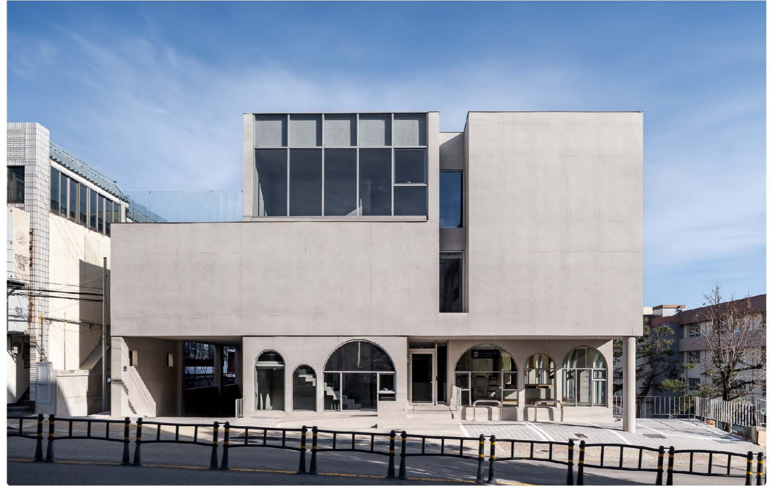
▲ 부산 남산동 동물병원의 정면모습 ▼ 동물병원의 아치가 잘 표현된 우측 전경