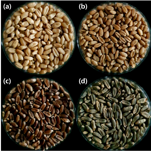
Fig. 1. Exterior appearance of wheat cultivars with different seed coat colors. (a) Keumgang; (b) Tapdong; (c) Arijinheuk; (d) IT016425.