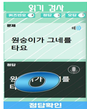
Fig. 5. Reading Test