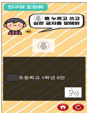
Fig. 3. Writing Friend