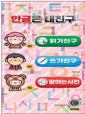
Fig. 1. Main screen

튼을 누르면 국립국어원 표준국어대사전의 낱말 뜻풀이가 나온다. 여러 개의 뜻(동형어)이 나올 때도 각각을 선택하여 음성 합성 버튼을 눌러 낱말의 뜻을 들을 수 있다.