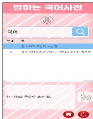
Fig. 4. Talking Dictionary