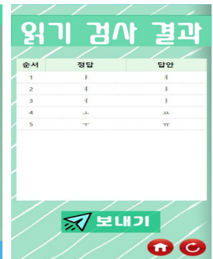
Fig. 6. Reading Test Results