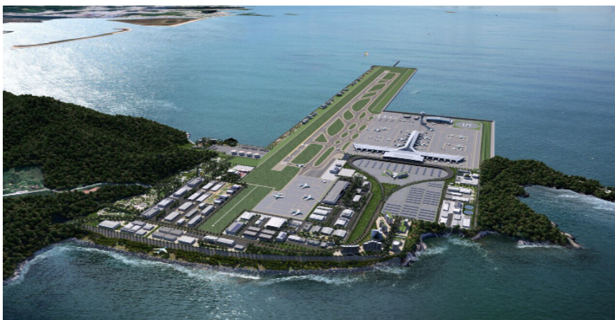
<그림 1> 부산가덕도 신공항 건설 조감도(부산광역시 제공)

행정주체가 개인의 권리 및 이익을 침해하였거나 또는 침해하려고 할 경우, 그로 인하여 발생하였거나 발생할 손실을 메우는 것을 말하는 ‘손실보상’은 단체주의사상을 기초로 하여 ‘사회적 평등부담의 원칙’의 실현을 이념으로 구성된 것이다. 따라서 원인행위 자체는 비난의 대상이 되지 않는 실정법에 근거한 적법한 행위이지만, 그 행위로 인하여 발생한 피해자의 ‘특별한 희생’을 어떻게 하면 사회적으로 공평하게 분배할 수 있느냐 하는 문제가 발생한다.