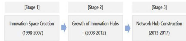
<Figure 1> Stages of the Technopark Development Project

테크노파크는 중앙정부 정책사업의 내용을 중심으로 <Figure 1> 과 같이 산업기술단지로서의 ‘(1단계) 혁신공간 조성기’, 지역전략산업 중심의 테크노파크의 지역 혁신거점 기능 강화를 위한 ‘(2단계) 혁신거점 성장기’, 그리고 지역 내 산·학·연·관 네트워크 허브 구축 사업을 중점적으로 추구한 ‘(3단계) 네트워크 허브 구축기’의 세 가지 단계로 구분할 수 있다[9, 11].