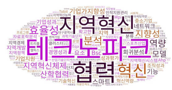
<Figure 3> WordCloud Visualization

지난 26년간 진행된 테크노파크 연구의 핵심 키워드를 살펴보면 테크노파크, 지역혁신, 협력, 혁신, 지역혁신체제 등으로 나타났다. 빈도수는 테크노파크가 47회로 현저하게 많이 나타났으며 그 다음으로는 지역혁신 7회, 협력 4회, 혁신 4회, 지역혁신체제 4회 등이 상대적으로 강조되고 있음을 확인할 수 있었다. 이는 테크노파크의 기능과 역할인 지역혁신과 지역 유관기관과의 교류 및 협력의 영역에 대한 연구가 중점적으로 이루어지고 있음을 시사한다.