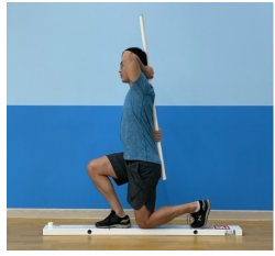
[Fig. 3] In-line Lunge(IL)