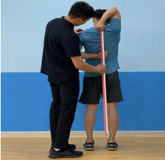
[Fig. 4] Shoulder Mobility(SM)