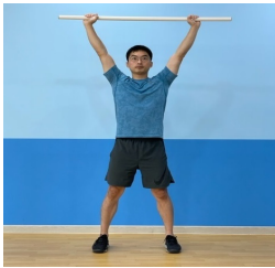
[Fig. 1] Deep Squat(DS)