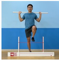
[Fig. 2] Huddle Step(HS)