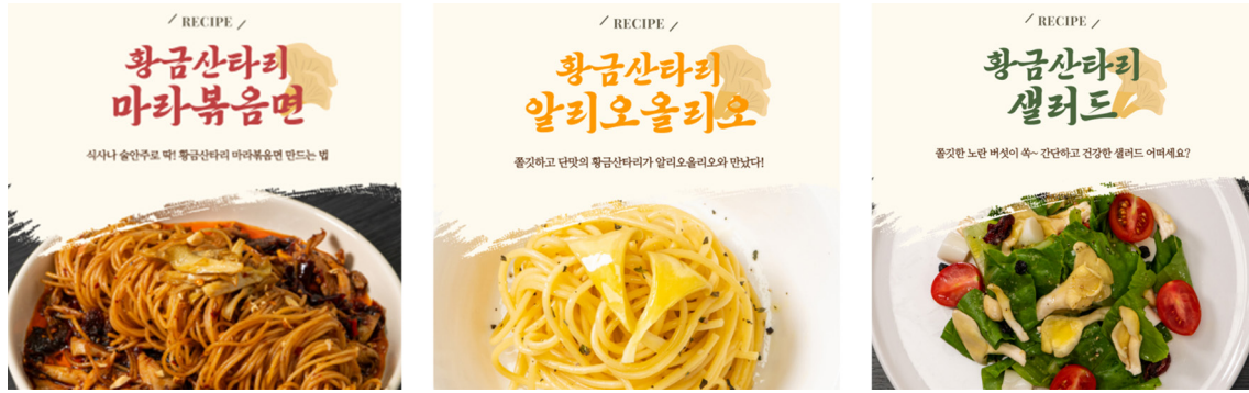
Fig. 4. SNS Promotion of 'Hwanggeumsantari' Cooking Recipes.

면서, 신선도 유지와 같은 저장성 문제는 더욱 중요한 이슈로 대두되고 있다.