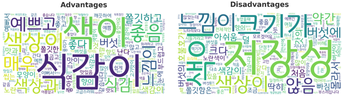
Fig. 1. Advantages and disadvantages of ‘Hwanggeumsantari’ as evaluated by consumers.