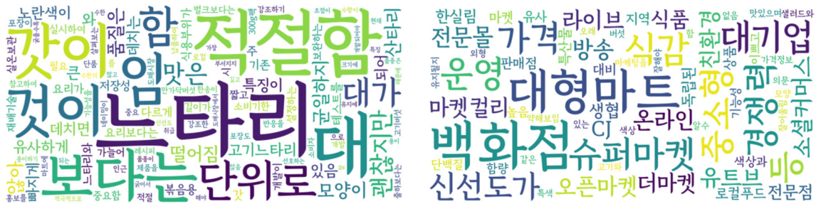
Fig. 2. Key points from the first(left) and second(right) FGI on the ‘Hwanggeumsantari’.

어, “향이 좋고 색상이 탁월하다”, “양이 많고 식감이 괜찮으며 예쁘게 생겼다”는 긍정적인 의견이 있었다. 반면, 단점으로는 크기의 균일성 부족과 저장성 문제가 지적되었다. 예를 들어, “전체적인 크기가 다소 크다”, “저장성은 좋은 것 같지 않다. 며칠 지나지 않았는데 시들해졌다”는 의견이 있었다(Fig. 1).