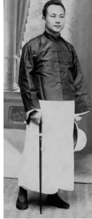
<Fig. 10> Long robe Reprinted from Chunmei Fox. (2015). https://wapbaike.baidu.com