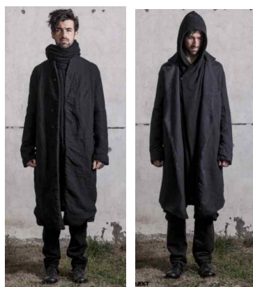
<Fig. 21> Ziggy Chen 2013 F/W