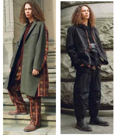
<Fig. 8> Ziggy Chen 2018 A/W