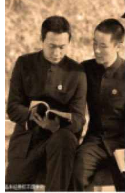
<Fig. 12> School uniform