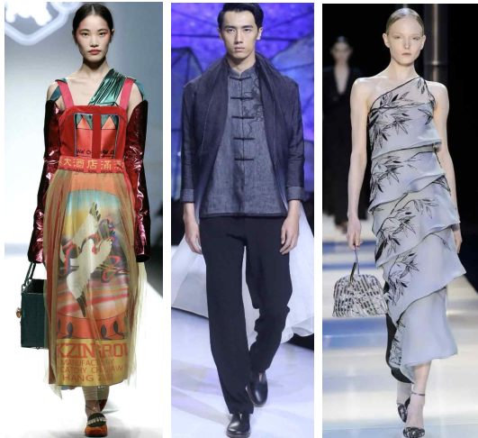
<Fig. 1> Mukzin 2017 FW Reprinted from Quan & Lee. (2015). <Fig. 2> Heaven Gaia 2016 SS Reprinted from Joe. (2015). https://www.malefashiontrends.com.mx <Fig. 3> Armani Prive 2015 SS Reprinted from White Wolf Black Technology. (2021). https://www.sohu.com

‘해체성’은 해체주의 차연, 상호텍스트, 탈구성, 탈현상 등을 기반으로 최근 친환경, 지속가능 기반 패션에서 해체와 재구성으로 주로 활용되고 있으며 의복의 구성과 설계에 대한 새로운 개념을 부여한다.