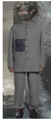
<Fig. 15> Ziggy Chen, 2021 S/S