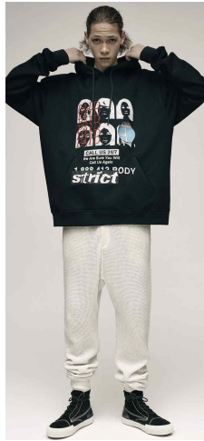
<Fig. 5> Alexander Wang 2016 FW

2002년에 여성 브랜드 ‘디코스터(Decoster)’의 디자인 총괄을 맡았다. 이후 2012년 본인의 남성복 브랜드 ‘Ziggy Chen’을 설립하였다(River Eleven, 2019). 지기 첸의 디자인은 전통과 현대의 조화를 바탕으로 렌 크로포드(Lane Crawford)의 ‘Created in China’ 프로젝트의 일부를 맡았으며, 실험적인 디자인과 중국의 전통 미학 연구가 어우러진 작품을 발표하고 있다(Lane Crawford, n.d.).