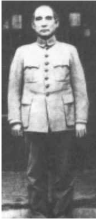
<Fig. 9> Zhongshan suit