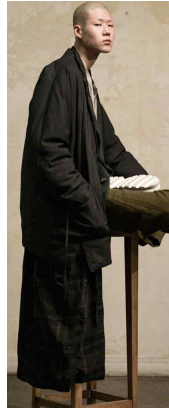
<Fig. 14> Ziggy Chen, 2020 A/W