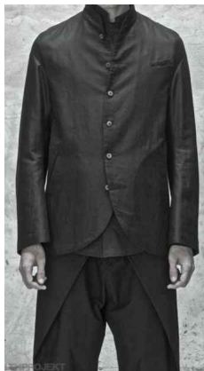
<Fig. 6> Ziggy Chen 2014 S/S

지기 첸은 2012년부터 2016년까지 현대와 클래식의 융합에 중점을 두고 패션에 동양적인 요소를 더 많