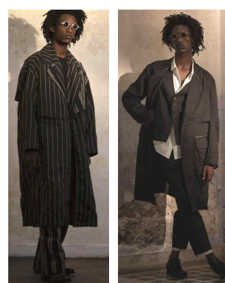
<Fig. 22> Ziggy Chen 2019 S/S