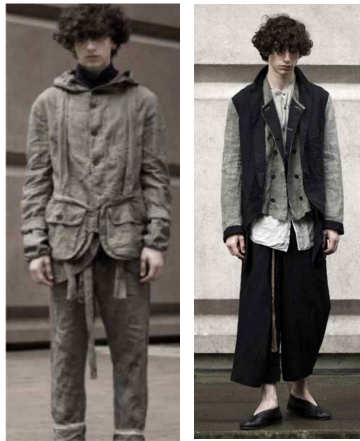
<Fig. 7> Ziggy Chen 2017 S/S