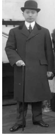
<Fig. 11> Suit