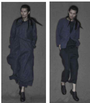
<Fig. 20> Ziggy Chen 2013 S/S Reprinted from Official Ziggy Chen. (2012). http://stealthprojekt.com

첫째, 다원적 융합성은 전통 복식 문화, 현대의 미적 감각, 라이프스타일과 결합된다. 지기 첸은 상하이 태생 디자이너로 현대와 고전, 동양과 서양의 미학 사