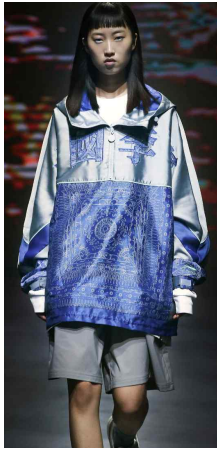
<Fig. 4> Li Ning 2021 SS Reprinted from Wang. (2021).