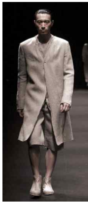
<Fig. 13> Ziggy Chen, 2012 S/S Reprinted from Tedore. (n.d.). http://www.tedore.at