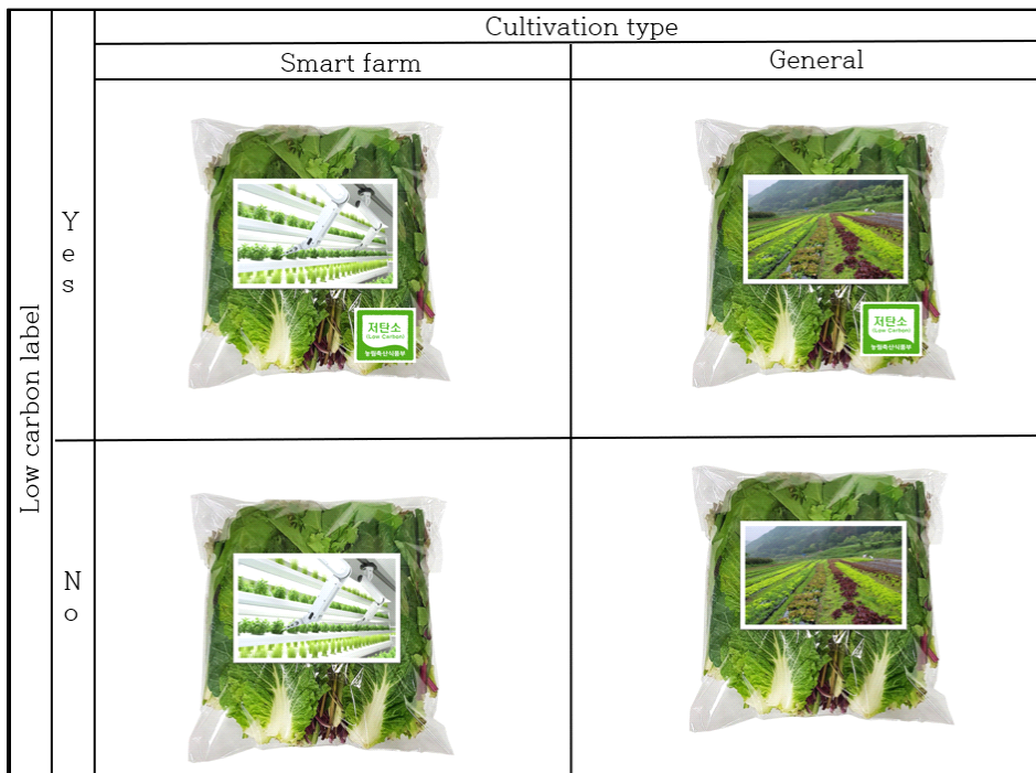
Figure 2. Experimental stimulus

스마트팜 재배란 농림축산식품부의 정의를 참고하여 4차 산업혁명 기술을 접목하여 작물과 가축의 생육환경을 원격·자동으로 적정하게 유지·관리할 수 있는 농장으로 정의하였으며, 따라서 스마트팜 재배 사진은 로봇 팔이 수직농장에서 채소를 재배하고 있는 사진으로 선택하였다. 일반 재배란 흙에 씨앗을 파종하고 밭에서 키우는 방법으로 정의하고 일반 재배 사진은 밭에서 자라고 있는 채소 사진으로 선택하여 자극물을 제작하였다. 실험자극물은 2(스마트팜 vs 일반 밭) x 2(저탄소 라벨 제시 vs 비제시)로 분류하여 4개의 집단 간 실험으로 설계하였으며, 국내에서 식재료 중 가장 먼저 저탄소 인증제도를 실시한 품목인 채소를 대상으로 제작하였다. 저탄소 인증 라벨은 농림축산식품부에서 운영 중인 저탄소 농축산물 인증제도에 사용되는 라벨을 각각 제시한 것과 제시하지 않은 것으로 구분하여 자극물을 제작하였으며, 스마트팜 재배와 일반 재배 사진을 넣고 <Figure 2>와 같이 설정하였다. 또한 공정한 실험을 위해 채소 유형별로 주어진 시각적인 정보를 제외한 조건은 모두 동일하게 설정하였다.