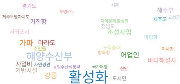
Fig. 2. Word cloud.

성화, 바다해설사, 어업인, 조성사업 등의 단어와 강릉, 거진항, 가파도 등 어촌관광 정책이 시행되는 장소들이 다수 언급되었다. 또한, 해양수산부와 어촌어항공단은 「어촌·어항법」 등 법적근거를 통해서 어촌관광 활성화를 위한 사업을 추진하고 있다. 세부사업으로 어촌의 경관개선, 체험프로그램 개발, 바다 해설사 양성 등이 있으며, 이 가운데 바다 해설사는 어촌자원과 문화에 대한 해설을 제공하는 전문 인력이다 어촌관광 활성화에 선도적 역할을 하게 된다(Yoon, 2022). 다양한 재정사업을 통해 어촌의 기반시설 확대와 소득증대를 꾀하는데, 거제시 장목항은 민간투자자 추진되는 장목 관광복합단지 개발과 연계하여 어촌관광과 판매시설에 대한 지원이 이루어졌다(Ministry of Oceans and Fisheries, 2023b). 강원도 양양군 수산항도 주민주도의 관광콘텐츠 개발 및 운영을 위한 수산항 복합단지 조성을 추진하고 있다(Ministry of Oceans and Fisheries, 2024). 이처럼 어촌관광은 기반시설 조성에서 확장하여 어촌공동체 중심의 콘텐츠 발굴 등을 통해 지속적으로 관광객을 유치하고자 한다.