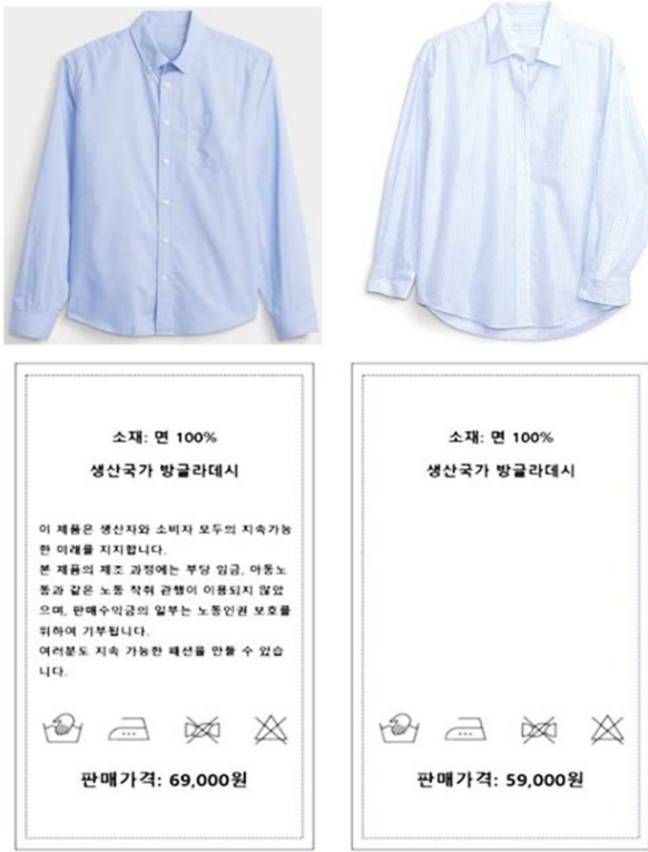
Fig. 2. Example of stimuli.

명을 대상으로 예비조사를 실시하여 본 자극물에 사용된 두 셔츠의 매력도에는 차이가 없음을 t-test를 통해 확인하였다( t = .47, p > .05 ). 또한 가격차이( t = -9.74, p < .05 ), 준거집단 영향력 차이( t = 65.66, p < .05 )를 제대로 인지하는 것으로 확인하여 자극물 조작이 제대로 된 것으로 판단하였다.