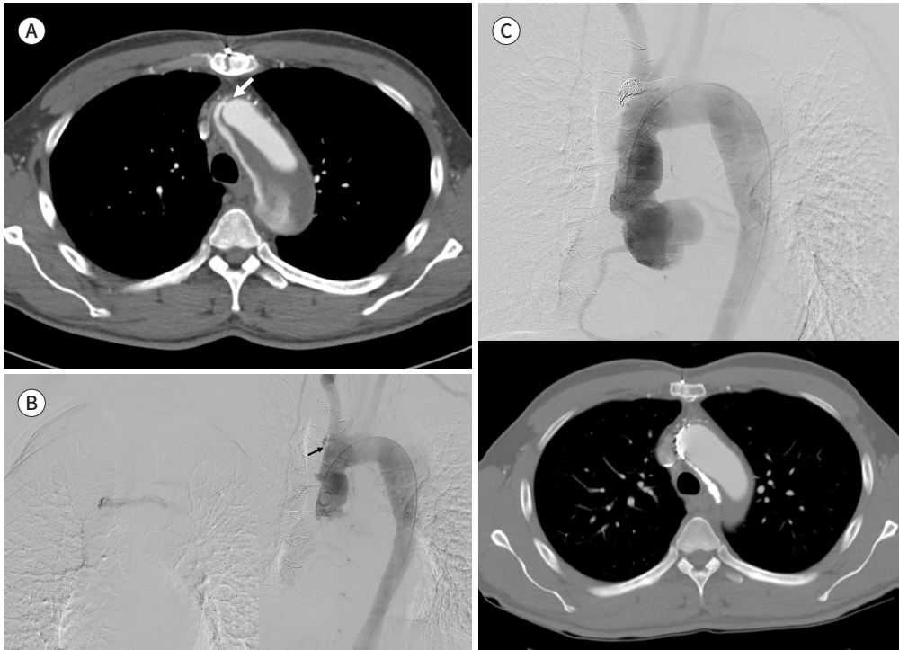
Fig. 1. A 55-year-old male presented with progressive false lumen enlargement in the aortic arch after ascending aortic graft replacement and hemiarch replacement for treatment of acute type A aortic dissection. A. Contrast-enhanced CT image obtained five days after ascending aortic replacement shows contrast leakage into the false lumen in the aortic arch (arrow). B. Thoracic contrast aortography (right) shows a leak at the distal anastomosis of the aortic graft replacement just below the orifice of the right brachiocephalic artery (arrow). False lumen angiography (left) shows sluggish antegrade dissecting flow in the aortic arch. C. Post-embolization thoracic aortography (top) shows occlusion of the aortic anastomotic leak and false lumen flow in the aortic arch. Contrast enhancement chest CT scan obtained five months after embolization (bottom) shows complete occlusion of anastomotic leak and false lumen by coils and N-butyl cyanoacrylate.

궁 가성 내강으로 관찰되며 매우 느린 혈류를 보였다(Fig. 1B, right). 이와 같이 가성 내강의 혈류가 매우 느린 원인은 문합부 누출 부위가 극소이며 좌측 신동맥 기시 부위에 있는 재진입 부위를 통한 역방향 혈류에 기인한 것으로 판단되었다.