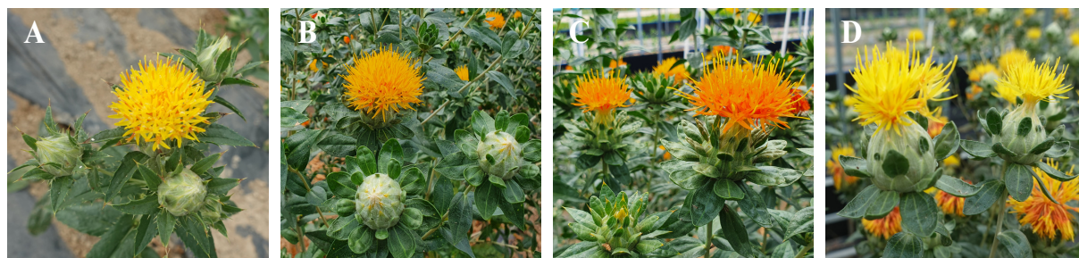
Fig. 3. Photos of four safflower genetic resources at flowering stage. A: local variety; B: IT323225; C: IT333473; D: IT333482.

잇꽃 4자원의 파종시기별 생육량을 조사한 결과(Table 3), 초장, 분지수, 주당 화기수, 화기당 종자수, 백립중, 주당 종자량 모든 항목에서 파종시기가 늦어질수록 감소(Nikabadi et al. , 2008)하는 경향을 보였다. 이와 같은 결과는 파종시기가 늦어질수록 개화 소요일수가 짧아져 기본 영양생장 기간이 상대적으로 짧은 것에 기인한 것으로 추정되었으며, 개화 유도 시기 또는 개화기 고온의 영향이 일부 있었을 것으로 생각되었다. 자원간 차이에서 재래종은 경관용 자원으로써 초장이 낮고 개화 소요일수가 짧은 장점을 가지나 다른 자원과 비교했을 때 총포의 가시(Fig. 3A), 분지수와 개화량, 종자 수량이 적었다. 반면 3자원의 개화 소요일수는 유사한 수준이며, 이중 IT323225 (Fig. 3B)는 IT333473 (Fig. 3C), IT333482 (Fig. 3D)에 비해 평균 초장(자원 순서대로 82.9, 90.9, 97.2 cm)이 짧고, 주당 화기수(27.1, 25.4, 24.2개)와 종자 생산량(31.2, 26.3, 17.1 g)이 많으면서 총포에 가시가 없어 4자원 중 경관용 조성 자원으로 가장 적합한 것으로 판단되었다.