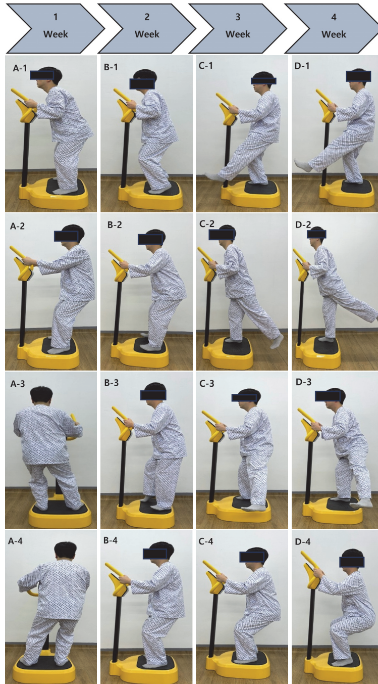
Fig. 2. Progressive balance training program with whole body vibration, A-1: weight bearing to anterior, A-2: weight bearing to posterior, A-3: weight bearing to left, A-4: weight bearing to right, B-1: calf raise, B-2: tiptop raise, B-3: tandem standing, B-4: semi-squat at 45 degrees, C-1: lift one leg forward at 30 degrees, C-2: lift one leg backward at 30 degrees, C-3: lift one leg sideward at 30 degrees, C-4: semi-squat at 60 degrees, D-1: lift one leg forward at 45 degrees, D-2: lift one leg backward at 45 degrees, D-3: lift one leg sideward at 45 degrees, D-4: squat at 90 degrees.