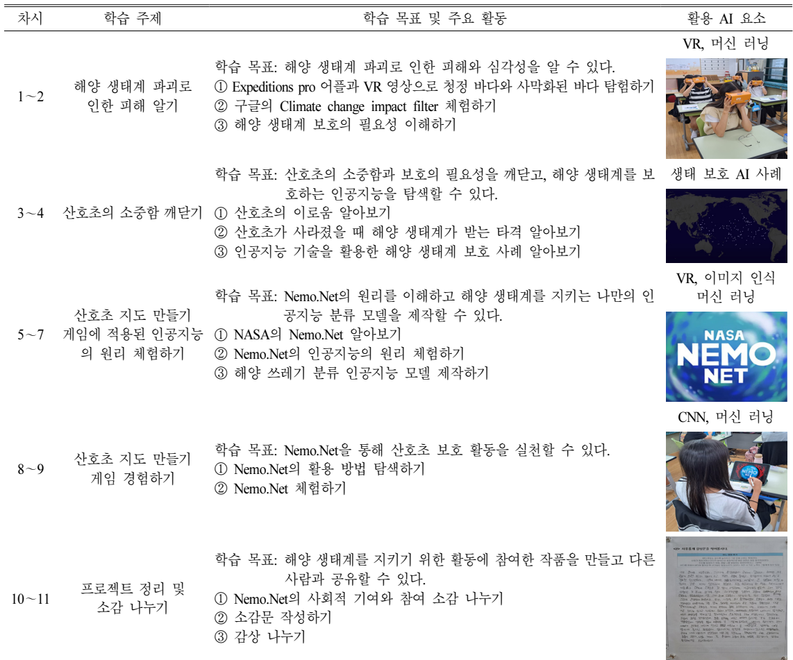
Table 5. A study on the course of teaching and learning by time

1~2차시의 학습 목표는 ‘해양 생태계 파괴로 인한 피해와 심각성을 알 수 있다.’이다. 이 수업의 목표는 여러 생태계 중 해양 생태계의 아름다움과 중요성을 인식하고 심각한 훼손이 진행되고 있는 해양