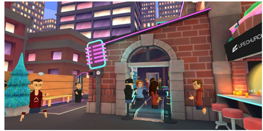
[Fig. 7] Metabus Church Created by Life Dot [8]

메타버스 교회 개척도 시도되고 있다. 로블록스에서 'church' 키워드로 검색을 해보면 교회 뿐만 아니라 약 마교회도 검색된다. 로블록스를 활용한 교회의 서버에 입장하면 대부분 교회의 요소인 예배실, 기도실, 친교실 등이 구현되어 있다. 반면 온라인 교회가 메타버스로 진출한 '라이프닷치' 교회도 있다. 이곳은 실제 교회의 구성요소와 비슷한 요소로 구현되어 있어 실지 교회와 메타버스 교회의 이질감을 감소시켰다. 만약 라이프닷치의 메타버스 교회 운영이 안정화된다면 이는 메타버스에 관심을 둔 교회에게 좋은 사례가 될 것으로 보인다. [Fig. 7]은 라이프닷치의 메타버스를 보여준다.