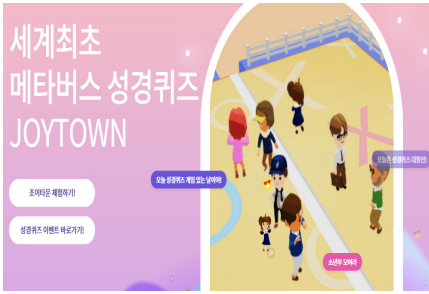
[Fig. 5] JoyTown

한국대학생선교회(CCC)의 C-On이 있다. 코로나19 때에 가상현실 공간에서 온라인 수련회를 진행한 경험을 바탕으로 C-On을 개발하였다.