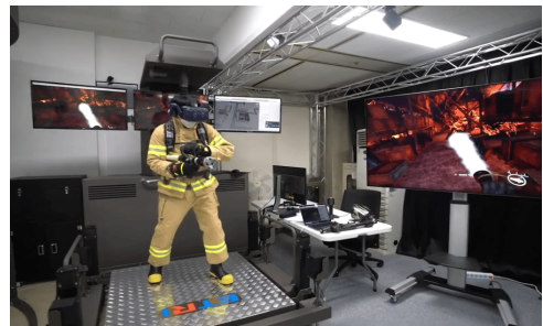
[Fig. 4] Firefighting training[7]

메타버스 교육이란 메타버스를 활용하여 실제 세계에서 배우는 것과 같은 실제감을 제공하여 교육하는 것을 말한다. 이는 기존의 주입식 교육에서 다중감각(Multi-sensory)을 통한 몰입 체험형 교육으로서의 변화를 의미한다. 이러한 교육은 다양한 분야에서 적용되고 있다. 대표적인 예로 한빛소프트의 메타버스 소방훈련이 있다. 현실과 같은 상황을 가상으로 구현하여 소방관들을 훈련시킨다. 확장현실(XR) 장비인 마이크로소프트 홀로렌즈2 및 메타 퀘스트 프로를 사용해 대피 훈련, 화재상황 체험 등의 콘텐츠들을 경험할 수 있다. 국내 메타버스 기업 '스코백'은 화학 사고 누출 사고를 가상으로 구현하여 훈련시키는 '대공간 기반 화학 사고 누출 대응 훈련 시스템'을 개발했다. [Fig. 4]는 소방훈련 스크린 샷을 보여준다.