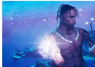
[Fig. 1] Travis Scott's Virtual Concert

가상 인물들이 인플루언서로 활동하며 패션, 뷰티 등 다양한 분야에서 영향력을 행사하고 있는 경우도 있다. 릴 미켈라는 인스타그램에서 300만 명 이상의 팔로워를 보유한 가상 인플루언서로, 패션 브랜드와 협업하였다.