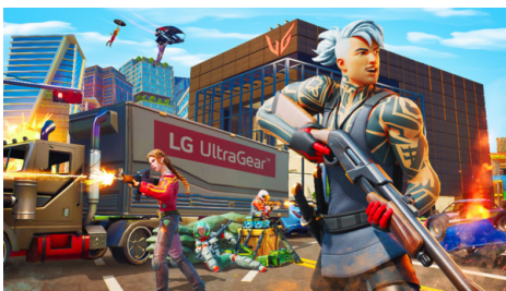
[Fig. 3] LG UltraGear[6]

나이키는 로블록스를 활용하여 '나이키랜드'를 구축하였다. 사용자들은 이곳에서 게임 플레이와 아바타에 옷을 착용시킬 수 있다. LG전자에서는 포트나이트 플랫폼을 활용하여 울트라기어를 만들었다. 이용자들은 실제 존재하는 건물들이 구현된 가상공간에서 브랜드 광고판 등을 보며 게임을 플레이한다[6]. [Fig. 3]은 LG 전자의 울트라기어를 보여준다.