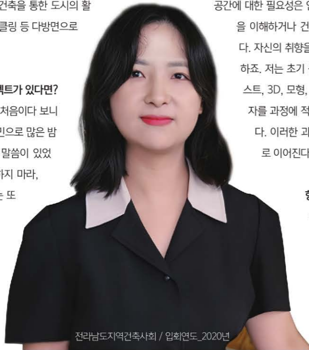
전라남도지역건축사회 / 임회연도_2020년

개소 후 처음 진행했던 첫 프로젝트입니다. 처음이다 보니 굉장한 부담감으로 아무것도 할 수 없어 고민으로 많은 밤을 지새웠습니다. 그때 은사님께서 해주신 말씀이 있었습니다. 첫 작품에 모든 것을 쏟아부으려 하지 마라, 올해의 너의 생각이 만든 작품이고 내년에는 또 다른 생각으로 새로운 것을 할 것이다, 모두가 너의 설계를 좋아할 수는 없지만 널 좋아하는 사람이 널 찾을 것이다, 화려한 건물보다 예산에 맞추어 잘 해내는 것도 중요하다 등과 같은 말들이 지금도 기억에 남아 있습니다. 첫 프로젝트를 진행하면서 과도한 디자인 욕심을 내려놓