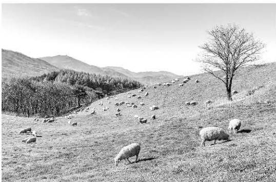
▲ 대상작 '힐링타임' (김재은)

농림축산식품부(장관 정황근, 이하 농식품부)와 (사)친환경축산협회(회장 이덕선)이 '2023 친환경축산 교육·홍보 사업'의 일환으로 개최한 '여행으로 만나는 아름다운 축산농장 사진공모전'의 수상작을 선정, 발표했다. '여행으로 만나는 아름다운 축산농장 사진공모전'은 유기축산물 인증 농장 혹은 방목생태 축산 지정농장에서 촬영한 목장의 아름다운 경관 사진을 주제로 실시됐다. 4월 28일부터 6월 30일까지 약 2달간 작품을 공모한 이번 사진공모전에는 150여점의 사진 작품이 접수되는 등 많은 관심을 받았다. 접수된 사진작품들은 사진 및 축산 전문가 5인으로 이뤄진 심사위원단의 1차 심사를 거쳐 25점의 우수작이 선정됐으며, 해당 우수작들을 대상으로 8월 4일부터 9월 17일까지 약 6주간 실시한 대국민 투표(2차 심사)를 거쳐 상위 8점의 수상작이 가려졌다. 대상은 심사위원 점수와 대국민 투표에서 모두 1위를 차지한 '힐