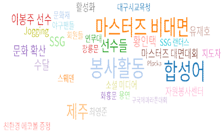
Fig. 2. Results of related word analysis related to 'Plogging' in the sports field.

하면 떠오르는 공정함, 페어플레이 정신 등의 긍정적인 이미지를 활용하여 환경에 대한 마케팅을 한 것으로 생각된다. 이는 스포츠가 사회 전반에 미치는 영향력이 크며 홍보 효과가 크기 때문이라고 생각된다. 김민철(2010)의 연구결과[25], 프로구단의 사회공헌활동이 소비자가 기업, 사회, 지역에 긍정적 이미지를 갖게 한다고 하여 본 연구를 지지해준다. 또한 Alan, Craig와 Victoria(2004)의 연구[26]에 따르면 운동선수의 역할모델 영향력이 청소년의 브랜드 충성도와 관련있다고 하여 본 연구를 부분적으로 지지해준다. 이처럼 스포츠의 영향력을 활용하여 향후 플로깅 활동이 다양한 생활체육 종목과 접목하여 플로깅 참여를 더욱 고취시킬 수 있는 기회를 확장 시켜야 할 것이다. 또한 스포츠 참여자에게 환경 문제에 대한 인식 제고 및 플로깅 등 환경 활동 참여 도모를 위한 자연친화적 스포츠 프로그램 및 기자재 등의 개발이 필요하다고 생각된다.