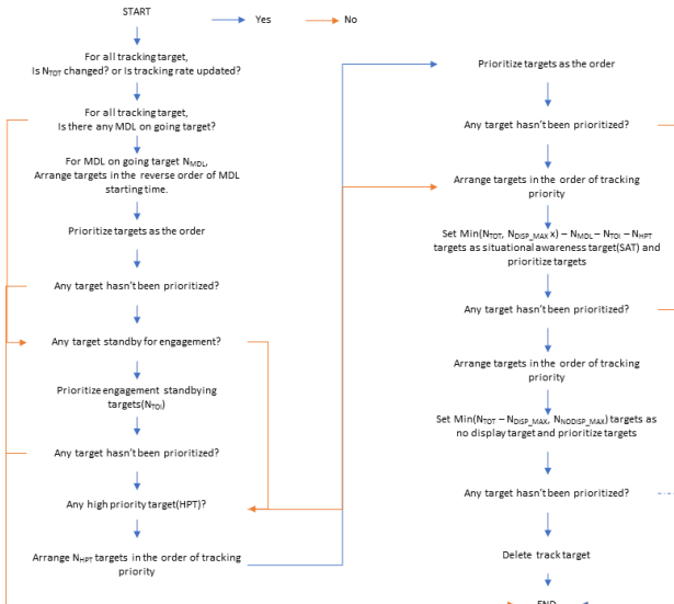
그림 3. 표적 우선순위 관리 규칙 Fig. 3. Target priority management rule

를 유도탄에 제공해 주기 위한 목적으로 교전중인 표적에 비 교전중인 표적보다 우선순위를 높게 할당하여 추적빔의 처리를 최고우선시하기 위함이다.