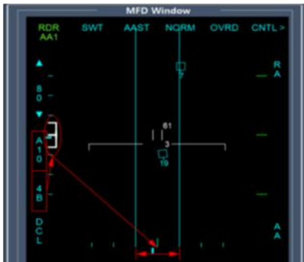
그림 2. 거리 스케일에 따른 표적관리(예시) Fig. 2. Track management per range scale(example)

따라서 본 논문에서는 MFD에 전시 가능한 최대 표적 추적 개수( N_{DISP\_MAX} 로 명명) 설정하고 레이더가 추적 가능한 표적 중 표적의 우선순위를 실시간 판단하여 높은 우선순위를 갖는 표적의 최대 N_{DISP\_MAX} 개를 MFD에 전시하도록 한다. 나머지 우선순위의 표적은 MFD 상에 전시하지 않지만, 레이더 내부적으로는 전시 표적과 동일하게 표적별로 개별 추적빔을 할당하여 추적을 유지, 표적의 우선순위를 판단할 수 있는 거리, 속도, 각도 정보를 획득하게 된다.