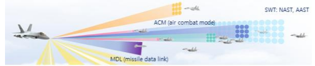
그림 1. 공대공 모드 운용 개념도

본 논문의 이해를 돕기 위해 공대공 모드의 운용모드 및 주요 기능은 그림 1과 표 1에 명시되어 있다. 공대공 운용모드 및 기능은 상황인식과 표적 탐지/추적을 위한 SWT 계열 모드, 근접교전을 위한 ACM (air combat maneuvering) 계열 모드로 구분된다. SWT 계열 모드는 고속으로 정면 접근하는 원거리 표적 탐지에 최적화된 NAST(nose aspect search and track) 모드와 전 방향의 표적을 탐지할 수 있는 AAST (all aspect search and track) 모드로 나뉜다. ACM 계열 모드는 탐색 영역에 따라