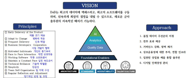
그림 2. 미 국방부 CDAO의 Data, 분석 및 AI 적용 전략 Fig 2. Data, analysis and AI application strategy of CDAO

미 국방부는 AI 윤리원칙을 공식화하고 AI 프로젝트 자금을 늘렸으며 AI 및 데이터 생태계를 구성하였다. AI 윤리원칙은 책임성, 형평성, 추적성, 신뢰성, 통제성에 대해 구체적으로 정의하고 있다. 이처럼 미국은 CDAO를 신설하여 거버넌스 체계를 갖추고 RAI S&IP를 통해 AI의 책임있는 활용을 추구하고 있다. 무엇보다도 미국은 AI 기술이 민간에서 매우 빠른 속도로 발전하는 특성을 고려하여 민간(산학연)과의 광범위한 협업 체제를 구축하여 “JCF 3) , Advana 4) , Tradewind 5) 등”으로 명명된 다양한 AI 및 데이터 플랫폼을 운영하고 각 군 및 전투 사령부를 지원하고 있다. 참고로, 미 국방부가 추구하고 있는 CDAO의 데이터, 분석 및 AI 적용 전략은 아래 그림의 비전, 원칙, 접근방법에서 어렵지 않게 이해할 수 있다.