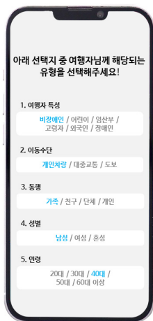
〈a〉 여행자 페르소나 설명 화면

본 연구에서 제안한 도서관 여행 코스 추천 모델이 궁극적으로 일반 이용자에게 활용되기 위해서는 웹(web) 또는 모바일 앱 형태로 개발되는 것이 가장 효율적이다. 본 절에서는 도서관 여행 코스 추천 모델을 적용한 모바일 앱의 목업을 제작하여 해당 모델의 활용 방안을 제시하고자 한다.