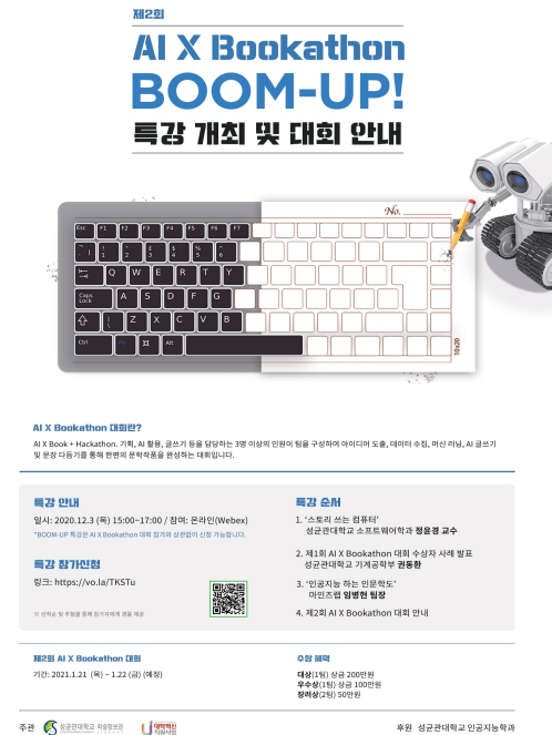
<그림 1> 제2회 AI x Bookathon 특강 포스터

내 AI 관련 전공 교수와 교외 AI 전문가를 초빙하여 특강을 진행해 프로그램 수강자들이 AI와 관련된 역량 즉 AI 리터러시를 함양할 수 있도록 도왔다. 둘째, 지속적으로 프로그램을 진행하는 과정에서 참여 대상을 A 대학 재학생에서 전국 대학교 재학생으로 확대 운영하여, 교육 제공의 폭을 증대시켰다.