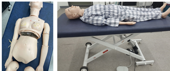
Fig. 2. Emergency experimental mannequin and bed.