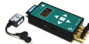
TELEMYO DTS Telemetry (Noraxon, USA)