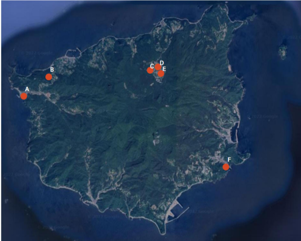
Fig. 1. Map of sampling sites in Ulleungdo.

을 안정화 시키고 유해 미생물의 증식을 억제하여, 장내미생물 생태계의 불균형 상태인 Dysbiosis를 예방하여 건강상 이점을 제공한다(Park et al., 2014; Seo et al., 2019).