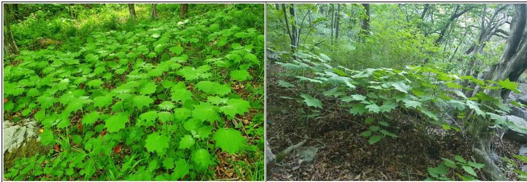
Figure 3. Status of K. koreana habitat.

※Detailed coordinates are omitted to prevent overcatching of endangered wildlife