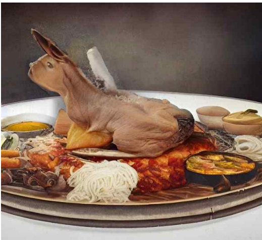
그림 3. 학생 B 작업 Figure 3. Student B's task