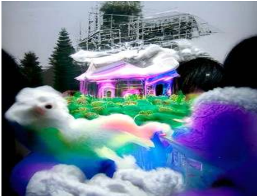
그림 2. 학생 A 작업 Figure 2. Student A's task

다. 이것은 향후 지속된 연구를 통해 입증될 필요가 있는 연구문제를 할 수 있다. 마지막으로 본 연구자가 1단계 페르소나 작성 과정과 창의적 글쓰기 단계에서 거론된 학생들 작업이 우수하다고 판단하였으나 다른 학생들의 많은 선택을 이끌어내지 못했다. 이는 연구자와 학생 간의 창의적 사고에 대한 기준에서 시대적 차이가 있음을 입증하는 예이다. 따라서 작품에 대한 평가 시 세대 간 차이를 보이는 창의적 사고 기준에 대한 고민이 필요할 것이다.