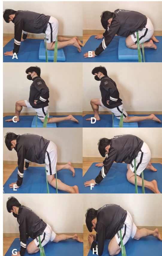
Fig. 3. Self-exercise for the hip. Self-exercise of hip flexion (A) start position (B) end position. Self-exercise of hip extension (C) start position (D) end position. Self-exercise of hip internal rotation (E) start position (F) end position. Self-exercise of hip external rotation (G) start position (H) end position.