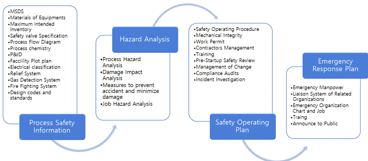
Fig. 1. Main contents of the process safety report.

수소는 입자가 작아서 일반적으로 재질 선정에서 고려하는 부식뿐만 아니라 침투 특성에 대해서도 고려할 필요가 있다. 황승국[18]은