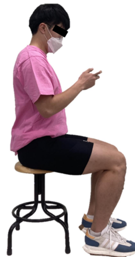
Figure 2. Sitting posture