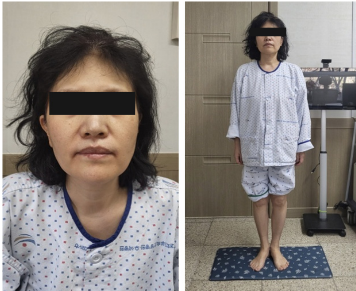
Figure 1. Sasang constitutional characteristics of the patient's appearance

4월 7일부터 퇴원일인 4월 21일까지는 미후등식장탕가감방A(Table 1)를 처방하였으며, 퇴원 후에는 미후등식장탕가감방B(Table 2)를 처방하였다. 미후등식장탕의 약물 구성 중 노근 및 앵도 등은 원내 재고상 누락하였다.