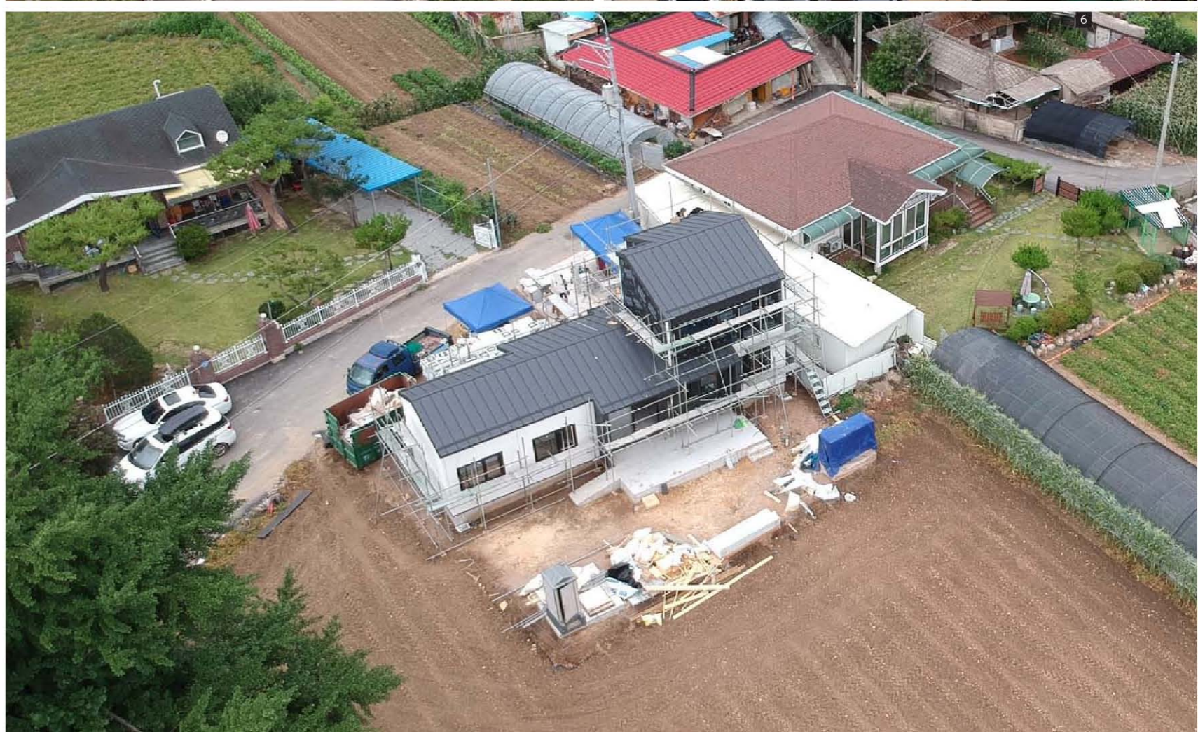
1. 외부 전경 2-6. 시공 과정 7. 거실과 주방 8. 침실 9. 계단