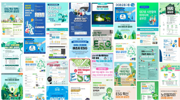
<그림 2> ESG 관련 각종 공모전 포스터²)

이렇듯 ESG는 이제 기업에서만 적용되는 것이 아니라 <그림 2>에서 보듯 지자체 및 정부기관 등의 공공기관과 관광, 서비스 교육 분야까지 사회 전반에 걸쳐 교육과 실천이 이루어지고 있다.