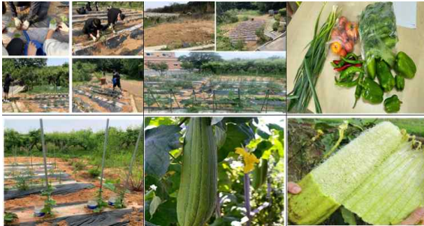
<그림 1> 천안동성중학교 텃밭 운영 활동

지구 위기로 인한 미래 먹거리의 심각성 등을 염려하며 자기 텃밭 공간을 할당받아 관리하게 하는 친환경 농업체험 활동으로 환경과 자신의 미래 진로를 생각하게 하는 기회를 제공해 오고 있다(김경민, 2022)¹).