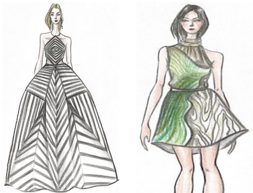
[Fig. 5] Architectural: South Africa Bosjes Church • Theme: Co-prosperity of Malleability and Inclusion

융합 수업의 가장 큰 어려움은 첫 번째 과정에서 디자인 기반으로 하는 융합적 탐구의 부분에서 각자 관심 있는 문제를 스스로 탐색하는 ‘연구 문제 도출’이었다. 학습공동체에 참여한 학생들은 전공 분야의 기초 지식에 대한 것은 이미 학습하였지만, 중국 교육을 받은 유학생