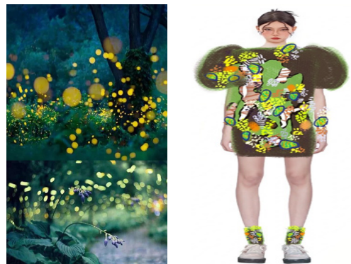
[Fig. 2] A combination of nature and human pleasure

• Theme: In the human mind, the braveness of tigers and the scent of roses coexist.