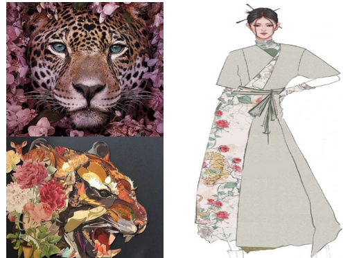
[Fig. 1] Combination of plants and animals: South Africa Bosjes Church

융합 수업의 가장 큰 어려움은 첫 번째 과정에서 디자인 기반으로 하는 융합적 탐구의 부분에서 각자 관심 있는 문제를 스스로 탐색하는 '연구 문제 도출'이었다. 학습공동체에 참여한 학생들은 전공 분야의 기초 지식에 대한 것은 이미 학습하였지만, 중국 교육을 받은 유학생이어서 새로운 방식으로 디자인을 표현하는 것에는 익숙하지 않아 당황하였다. 이것을 해결하기 위하여 패션이라는 특정 학문에서만 한정시키지 않고 다양한 측면에서 아이디어를 찾도록 하였다.