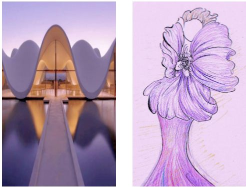
[Fig. 3] Architectural: South Africa Bosjes Church • Theme: Co-prosperity of Malleability and Inclusion.