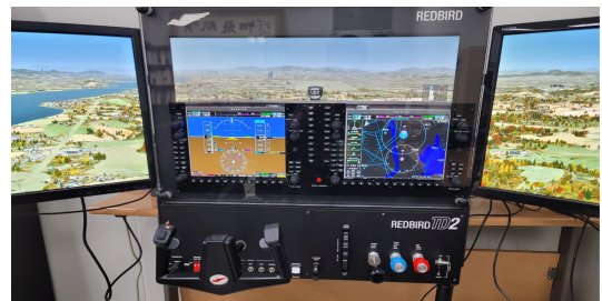
Fig. 1. Cockpit view of BATD (Redbird TD)

행기에 가장 널리 보급된 형태인 PFD(primary flight display)와 MFD(multi- function display)로 구성된 Glass Cockpit을 채용하여 호환성을 높였다. 또한, 계기판 양쪽에 두 대의 확장 모니터를 장착하면 다른 데스크톱 모의비행훈련장치에서 불가능한 광범위한 시각적 조종을 수행할 수 있고, 넓은 시야가 시계비행 환경을 구현하여 몰입적인 훈련 경험을 할 수 있도록 돕는다.