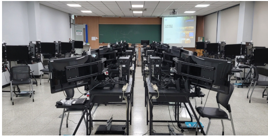
Fig. 2. Classroom equipped with BATD