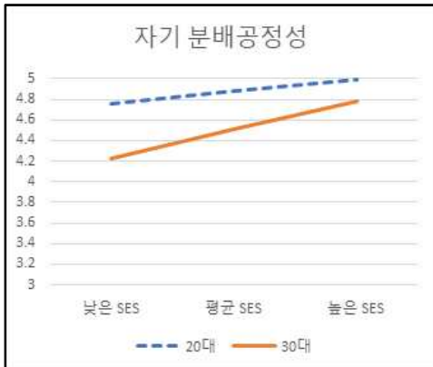
그림 2. 연령대별 SES가 자기 분배공정성에 미치는 영향