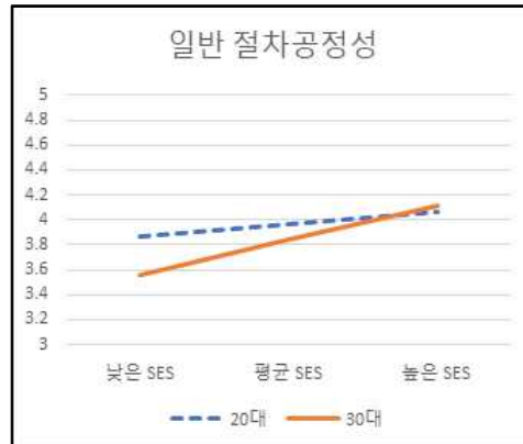
그림 3. 연령대별 SES가 일반 절차공정성에 미치는 영향

주관적 사회경제적 지위가 자기 분배공정성만을 유의하게 예측하고, 그 강도는 30대 이상보다 약한 것으로 나타났다.