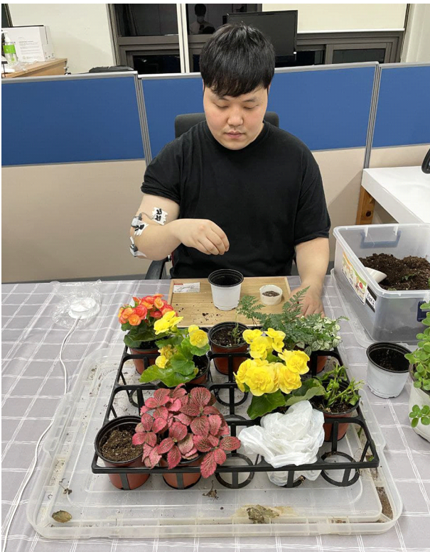
Figure 2. Experimental setup for horiculture motion and electrodes

쪽 80% 지점에 위치시켰다(Figure 2). 마비측(우세측) 손을 스위치 위에 올려놓고 편안하게 앉은 상태에서 시작 신호에 맞추어 스위치에서 손을 떼고 원예 동작 9가지와 상지 재활 동작 3가지를 실시하였다. 스위치에서 손이 떨어지는 지점을 동작의 시작 지점으로 설정하고 동작을 마친 후 다시 스위치를 누르면 동작의 끝 지점으로 하여 이동시간을 측정하였다.