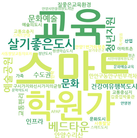
〈그림 3〉 안양시 사서들이 응답한 안양시 정체성