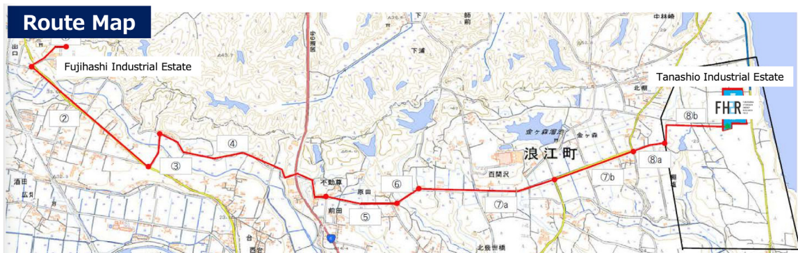
Fig. 3. Map of power transmission line 29)