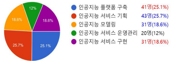
Fig. 2. AI Developer Job Fields

설문 조사는 AI 관련 산업에 재직 중인 AI 개발자(업무 경력 5년 이하)를 대상으로 실시한다. 설문 조사에 참여한 AI 개발자 수는 166명이며, 직무 분야는 그림 2와 같다.