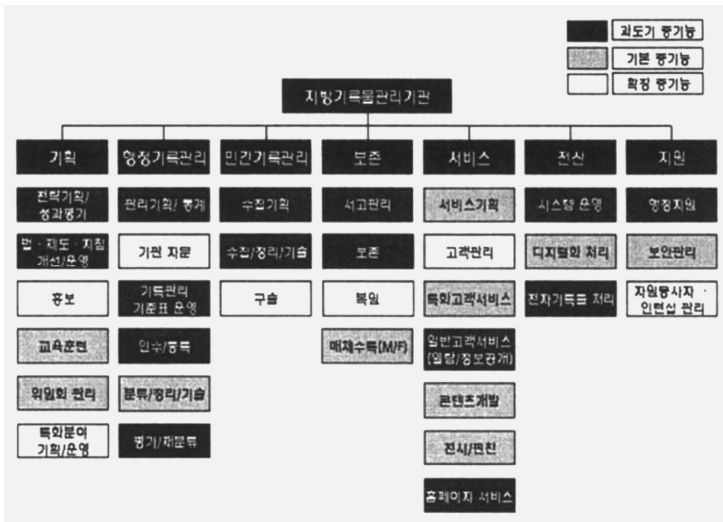
<그림 1> 시·도 지방기록물관리기관의 표준기능모델

한 효율적인 기록관리체계를 갖추기 위한 확장기능까지 총 3단계로 구성되어 있다. 각 단계별 수행해야 하는 기능은 <그림 1>을 보면 알 수 있다. 앞서 언급한 지방기록물관리기관의 인력배치 및 구성의 내용을 담은 표준조직모델 역시 표준기능모델의 단계에 맞추어 과도기, 기본, 확장 기능으로 설계되었다.