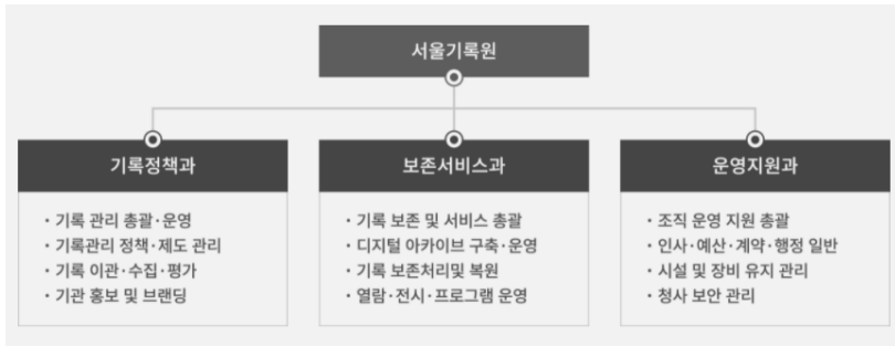
〈그림 3〉 서울기록원 조직도

온·오프라인 열람, 검색, 이용자 교육, 프로그램 등의 기록정보서비스 업무를 수행한다. 그중 민간기록관리 관련 업무를 담당하는 인력은 기록정책과의 서울기록화 사업 담당자와 보존서비스과의 교육 및 프로그램 담당자 2명으로 볼 수 있다. 6) 이는 국가기록원 연구에서 명시한 과도기 단계 인원과 유사한 수이지만, 현재 서울기록원의 민간기록관리에 투입한 인력과 예산 비중은 그보다 더 크다고 볼 수 있다. 그럼에도 서울기록원은 실질적으로 기관에서 민간기록관리 관련 업무를 수행하기 위한 인원으로 현재 정원이 충분하지 않다고 밝히고 있다.