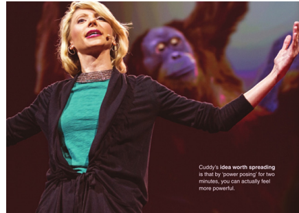
In this lesson, you are going to watch segments of Cuddy's TED Talk. Use the information about Cuddy on page 100 to answer the questions.

교재는 N사의 것으로 10과로 구성되었고 각 단원의 제목은 Fragile forests, Bright Ideas, Data Detectives 등으로 주로 최신기술, 지구환경, 인간관계, 일상의 삶 등에 대한 내용들이다. 한 단원은 두 개의 섹션으로 나뉘고 첫 섹션은 독해문으로 듣기와 연습문제 등이 포함되어 있다. 두 번째 섹션은 TED talk으로 동영상상이 제공되고 연관 연습문제가 있다. 각 단원의 마지막에는 TED talk의 주제와 유사한 주제를 가지고 학습자가 직접 발표원고를 작성하여 발표하는 활동이 포함되어 있다. 교재의 예는 [그림 1]과 같다.