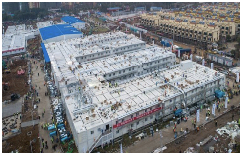
[그림 1] 휘선산 병원 건설과정

2020년 2월 보도에 따르면 확진자 1만 7000여 명과 사망자 361명이 중국에 발생하였다. 1) 중국 국가 위생 건강위원회의 최근 통계에 따르면 의심 사례 2만 천여 명이며 15만 2천 7백 명이 의료 감시 중이었다. 이후 중국 관영매체들은 2020년 2월 3일 휘선산 건립 완료와 개원을 보도했다. 1,000병상과 30개의 중환자실을 갖고 있는 이 대규모 병원은 8일만에 건설되어 세계의 이목을 집중시켰고 그 가능성의 중심에는 모듈러 건축 기술이 있었다.