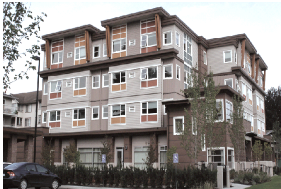
[그림 3] Atlantic B2 Project, 아파트, 미국 뉴욕, 연면적 약 2,500m 2