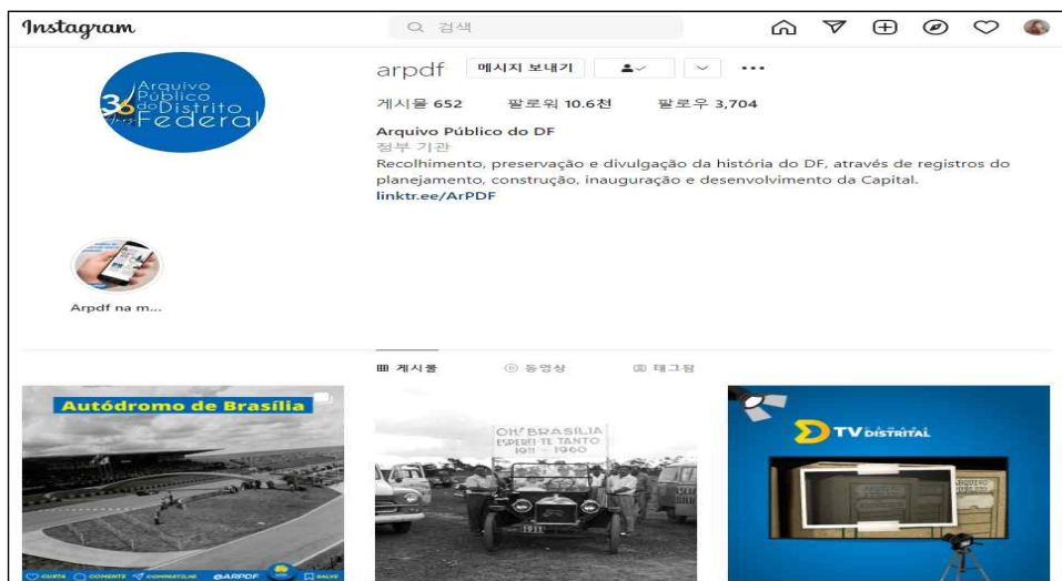
〈그림 4〉 ArPDF의 SNS 계정을 활용한 홍보

또한 페이스북, 인스타그램 등의 공식 SNS 계정을 개설하여 브라질리아의 계획, 건설, 개발에 관한 기록물 컬렉션의 소개와 함께 행사 등의 홍보활동을 활발히 진행하고 있다.