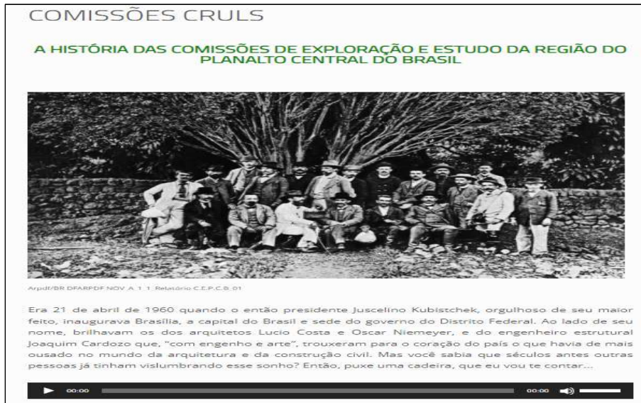
〈그림 5〉 브라질 중부고원 탐사연구위원회의 역사 가상 전시화면

가상전시는 각 테마별로 주제와 관련된 사진, 영상 등 시청각 기록물 위주로 기획되었다. 5개의 주제별로 전시하고 있는 기록물에 대한 간략한 정보가 텍스트와 음성파일로 제공되고 있다. ArPDF 웹사이트에서 전시회 링크를 클릭하면 해당 전시를 즉시 관람할 수 있다. <그림 5>는 브라질 중부고원 탐사연구위원회의 역사와 관련된 가상 전시화면의 일부로 사진 기록물을 활용하여 그에 대한 배경 설명이 텍스트로 제공되고 있으며, 하단의 재생버튼을 클릭하면 해당내용의 음성파일이 재생된다.