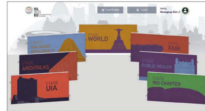
<사진2> 건축사대회의 7개 스테이지

본대회는 7개의 스테이지로 구성되어 있다. 스테이지는 <사진2>와 같이 ▲UIA ▲건축토론(ArchiTalk) ▲사회와의 대화(Dialogues with Society) ▲World ▲엑스포 전시(Expo Fair) ▲공중 보건(Public Health) ▲브라질 건축사협회(IAB, Instituto de Arquitetos do Brasil) 리오 지부 (Rio Charter) 등이다.