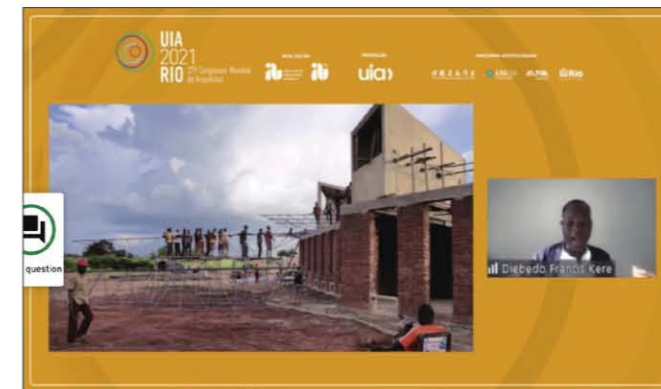
<사진3> 프란시스 케레(Francis Kéré)의 학교 프로젝트