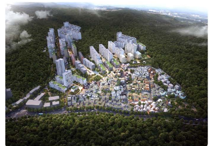
개발 이후의 조감도

백사마을은 1967년 도심 개발로 청계천·창신동·영등포 등에서 강제 철거당한 주민이 이주하면서 형성된 주거지다. 2009년 주택 재개발구역으로 지정돼 개발이 가시화되는 듯했다. 그러나 사업성 문제, 건축 방식을 둘러싼 갈등 등으로 사업이 지연됐다. 그러던 지난 3월 2일, 노원구는 중계본동 104번지 일대 백사마을(18만6965㎡) 재개발 예정지에 대한 사업시행계획을 인가했다고 밝혔다. 계획안에 따라 60여 년 된 노후 저층 주거지가 총 2,437가구 규모의 주거단지로 탈바꿈한다. 재개발 정비구역으로 지정된 지 12년 만이다. 백사마을은 일반적인 재개발과 달리 단독주택과 아파트가 어우러진 주거지 보존 방식이 적용된다. 아파트는 지하 5층~지상 최고 20층, 34개 동, 전용면적 59~190㎡, 1,953가구로 지어진다. 일반주택은 주거지 보전사업으로 지하 4층~지상 4층의 다세대주택 136개 동, 484가구가 들어선다. 전용면적은 30~85㎡ 미만이다. 9명의 건축사가 각기 다른 디자인으로 다양한 층수의 아파트와 일반주택을 적절히 배치해 자연경관을 살리고, 골목길 등 기존 지형을 일부 보존해 과거와 현재가 공존하도록 했다고 노원구는 설명했다.