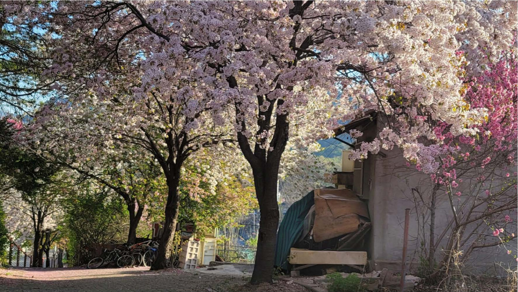
마을 입구 한편에 핀 벚꽃

다시 골목길을 따라 아래로 내려오다 보니 웅기증기 화분에 심어진 파와 부추가 파릇파릇하다. 얼마 후면 빈 화분에도 고추와 호박 모종이 심어질 것이다. 마을을 벗어날 즈음, 하얀 페인트칠이 반쯤 벗겨진 건물 벽에 누군가 노랑과 빨간 꽃들을 어설피게 그려 놓은 것이 눈에 띈다.