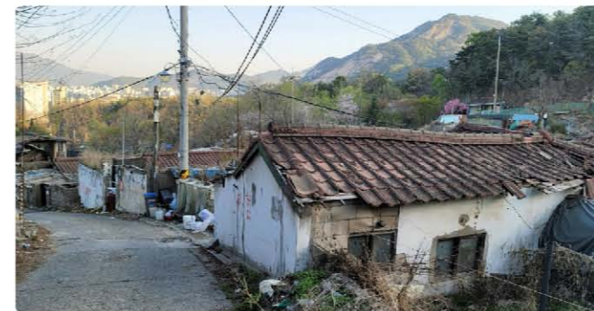
퇴락한 건물 뒤로 보이는 불암산