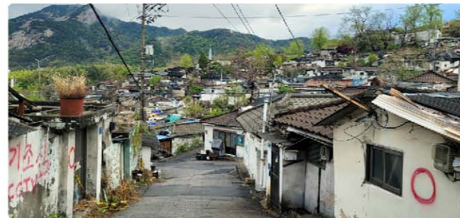
마을 입구에서 본 백사마을(건물에 ○ 표시는 공가로 비어 있는 집) 뒤로 불암산이 보인다.

1967년 당시 개발을 이유로 정부에서 청계천 등 판자촌에 살던 사람들을 강제 이주시켜 마련해 준 보금자리다. 8~20평 남짓한 허름한 집 1,200여 가구의 절반 이상이 현재 빈집(공가)으로 남아있다.