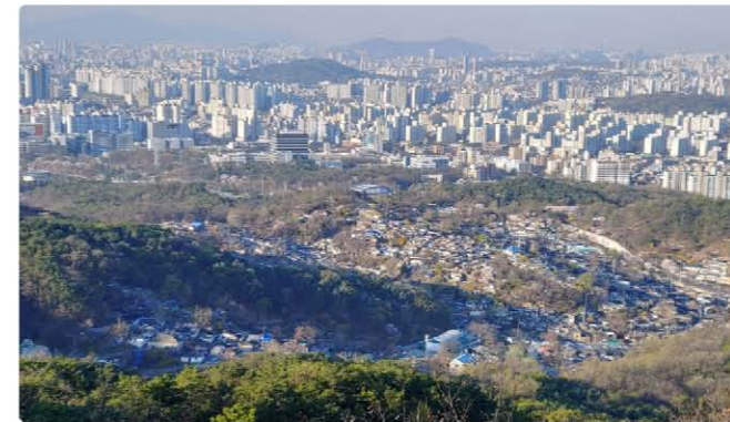
불암산 위에서 본 백사마을 전경

수년 전부터 추진해온 재개발을 앞두고 내년에 착공 예정이라고 하니 어쩌면 지금의 모습이 마지막이 될지도 모른다. 백사마을의 마지막 봄이라 생각하니 지금껏 수없이 찾아와 보았던 모습과 달리 더 각별하고 애뜻하게 보인다. 남녘에는 진즉부터 봄이 찾아와 매화꽃이 한창이라지만, 코로나 때문에 좋아하는 여행도 못하고 동네 주변만 맴돌다 집 가까운 불암산 가는 걸 낙으로 여기고 내려올 때 가끔씩 둘러보던 백사마을. 서울에서 느낄 수 있는 마지막 고향 같은 곳이기에 봄이 가기 전에 다시 또 찾아가 보았다.