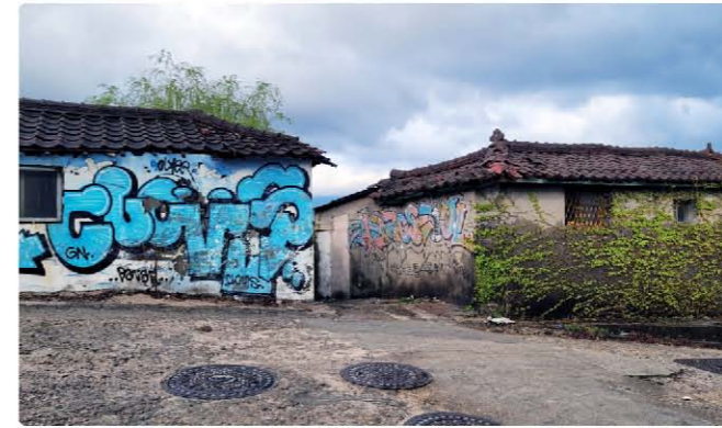
언덕 위의 두 집, 내부는 빈 상태로 허물어져 있다.

수년 전부터 추진해온 재개발을 앞두고 내년에 착공 예정이라고 하니 어쩌면 지금의 모습이 마지막이 될지도 모른다. 백사마을의 마지막 봄이라 생각하니 지금껏 수없이 찾아와 보았던 모습과 달리 더 각별하고 애뜻하게 보인다. 남녘에는 진즉부터 봄이 찾아와 매화꽃이 한창이라지만, 코로나 때문에 좋아하는 여행도 못하고 동네 주변만 맴돌다 집 가까운 불암산 가는 걸 낙으로 여기고 내려올 때 가끔씩 둘러보던 백사마을. 서울에서 느낄 수 있는 마지막 고향 같은 곳이기에 봄이 가기 전에 다시 또 찾아가 보았다.