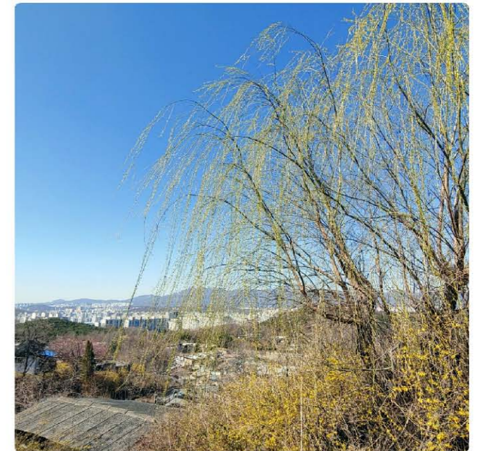
언덕 위에서 바라본 마을 전경. 멀리 북한산이 보인다.

이곳은 주로 연탄을 때느라 굴뚝으로 연기가 피어오르고 집 앞에는 연탄재가 쌓여있다. 동네에서 가장 높은 언덕에 올라서니 폐허처럼 변해버린 집 앞에 언뜻빛으로 물이 오른 수양버들이 바람에 하늘거린다. 그 아래엔 셋노란 개나리가 무리지어 꽃을 피우고 있었다. 그리고 계막지 같은 납작 지붕 너머로 고층아파트들이 딴 세상처럼 보이고 또 그 너머로 북한산이 보인다.