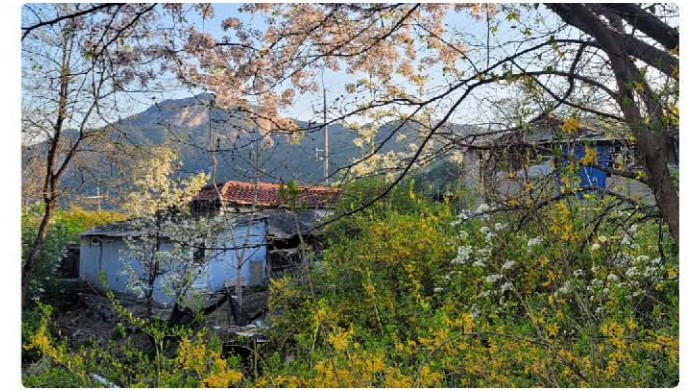
봄꽃 사이로 보이는 노후 건물

이제는 개 짖는 소리조차 들리지 않고 고요한데 빈집 가운데서 목련이 하얀 꽃을 피우고 있었다. 쓰러져가는 집들과 함께 사진으로 남기고 좁은 골목길을 따라 언덕으로 올라가는데, 파란 나무대문 집에 혼자 사시는 할머니가 조반을 준비하고 계셨다. 매캐한 연기와 함께 퍼지는 밥 짓고 고등어 굽는 냄새가 요 며칠 잃었던 식욕을 자극한다.