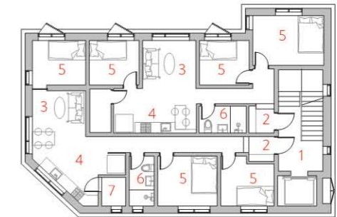
2, 3층 평면도