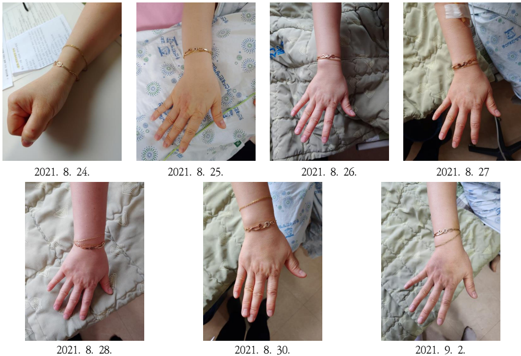
Fig. 3. The Amelioration of the Zoster Lesion on the Right Hand