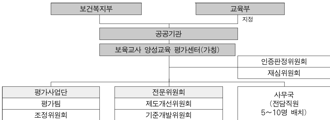
그림 1. 보육교사 양성학과 평가·인증 인정기관 조직 구성(안)

위 고려사항들을 바탕으로 보육교사 양성학과 평가·인증 인정기관을 보건복지부 산하 공공기관의 하부 조직으로 구성하고, 인정기관에 평가·인증 운영을 위한 인증판정위원회, 재심위원회, 평가사업단, 전문위원회, 사무국 등을 두는 방안을 제안한다. 인증판정위원회, 재심위원회, 평가사업단, 전문위원회 경우 위원은 구성되어 있으나 비상시 조직으로 평가 및 해당 업무가 있을 때 활동하도록 한다.